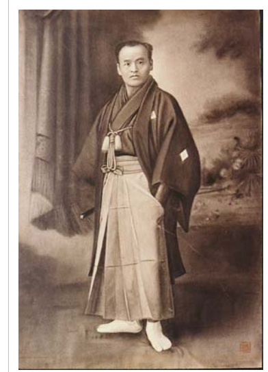
Takeda Sokaku'nun rötuşlanmış fotoğrafı 1888

Aikidonun teknik müfredatı şüphesi çoğunlukla Takeda Sokaku'nun derslerinden etkilenmiştir. [1] Gerçi bazı iddalar, Takeda'nın muhasebe defterleri açıkça Ueshibanın Daito-ryu çalışmalarına 1915 ve 1937 arasında epey zaman harcadığını gösteriyor. Aynı zamanda önemli listelerin çoğunluğunu Takeda tarafından ödüllendirerek almıştır; the Hiden Mokuroko, the Hiden Ogi ve the Goshin'yo te. Ueshiba kyoju dairi sertifikasını veya eğitimlik sertifikasını 1922'de Takeda'dan aldı. Takeda henüz bir menkyo lisans olarak yürürlüğe koymamıştır veya başarı lisansın üst basamağı olarak, bu zamanda bu sistem içinde. ayrıca 1922de Ayabe'de Takeda'dan kılıç aktarma listesi bir Kashima Shinden Jikishinkage-ryu almıştır. Ueshiba ardından Daito-ryu bir mübessili olmuştur. Takeda ile eğitim asistanı olarak ve Daito-ryu adı altında sistemi diğerlerine öğretmiştir. [1]